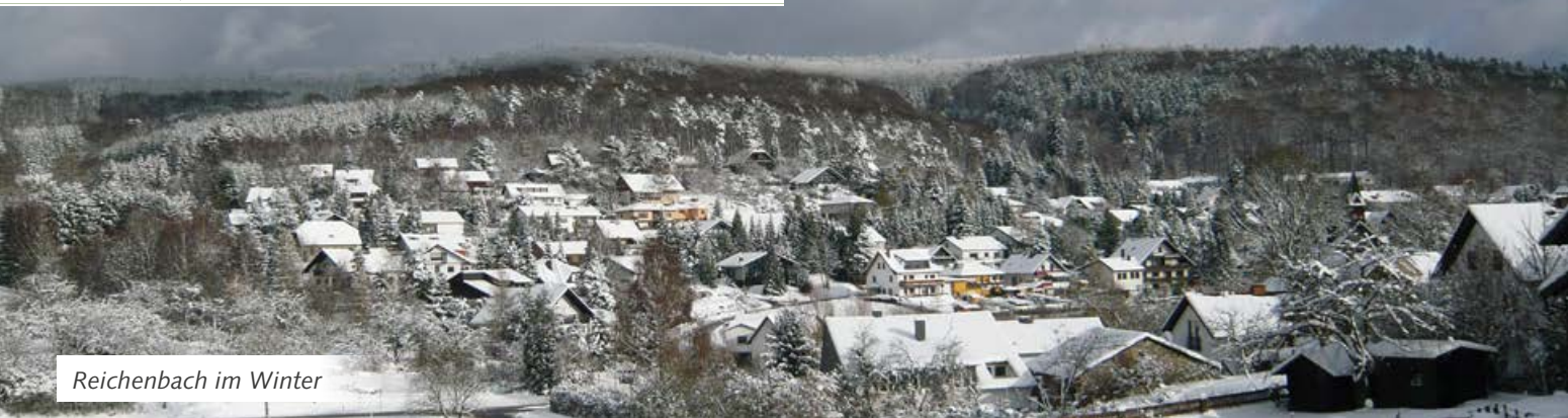
Reichenbach im Winter

die vorgeschichtlichen Wein- und Wagenstraßen vereinen, sowie die ehemalige Siedlung „Liegenhausen“ sind jedoch Spuren einer intensiven Besiedlung, die bis in die vorchristliche Zeit zurückreicht. Im Jahre 1772 wurde durch eine Feuersbrunst der alte Ortskern völlig zerstört. Die Reichenbacher ließen sich jedoch weder durch diese noch durch weitere schwere Katastrophen entmutigen; sie begannen jeweils zügig mit dem Wiederaufbau und entwickelten den heutigen Ortsteil Reichenbach zu einem bevorzugten Wohngebiet innerhalb der Gemeinde Waldems.