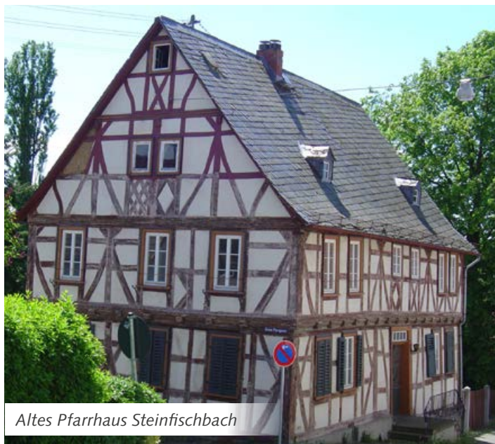
Altes Pfarrhaus Steinfischbach

Heute ist die Gemeinde eine Wohngemeinde im Ballungsraum Rhein-Main, die Wege in die Zentren sind kurz. Frankfurt ist in rund 45 Minuten erreichbar, Wiesbaden in 25–30 Minuten. Die Fahrt zum Flughafen Frankfurt benötigt ca. 35 Minuten. Den nächsten Bahnhof in Idstein erreicht man in rund 10 Minuten, ebenfalls die Autobahn A 3. Die Breitbandverfügbarkeit ist in allen Ortsteilen mit Bandbreiten von 50 Mbit und mehr gewährleistet. Gewerbegebiete gibt es in den Ortsteilen Esch und Steinfischbach, hier haben sich unterschiedliche Unternehmen angesiedelt. Die Branchen reichen von der Medizintechnik über einen Spieleverlag und einen Marktforscher bis hin zu professionellen Gitarrenbauern. In allen Ortsteilen sind darüber hinaus zahlreiche Handwerksbetriebe zu finden. Die Ortsteile haben sich ihren dörflichen Charakter bewahrt, so bestehen in den meisten Dörfern auch noch landwirtschaftliche Betriebe mit und ohne Tierhaltung.